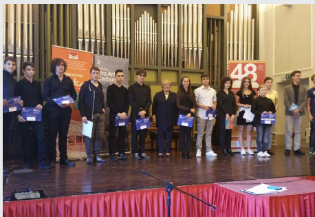
Candidates at the 2015 Pittaluga JR

Sul sito www.pittaluga.org verranno pubblicati per tempo hotel convenzionati ed informazioni aggiuntive.