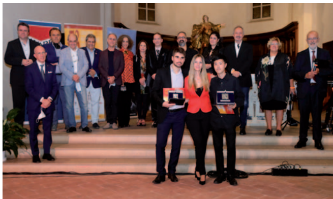
Premiati, Giuria ed Autorità al 53° Concorso Pittaluga

Piazza Garibaldi 16 - 15121 Alessandria (Italia) Fax 0039-0131-25.31.70 - Tel. 0039-0131-25.31.70 / 25.12.07 e-mail: concorso@pittaluga.org - www.pittaluga.org